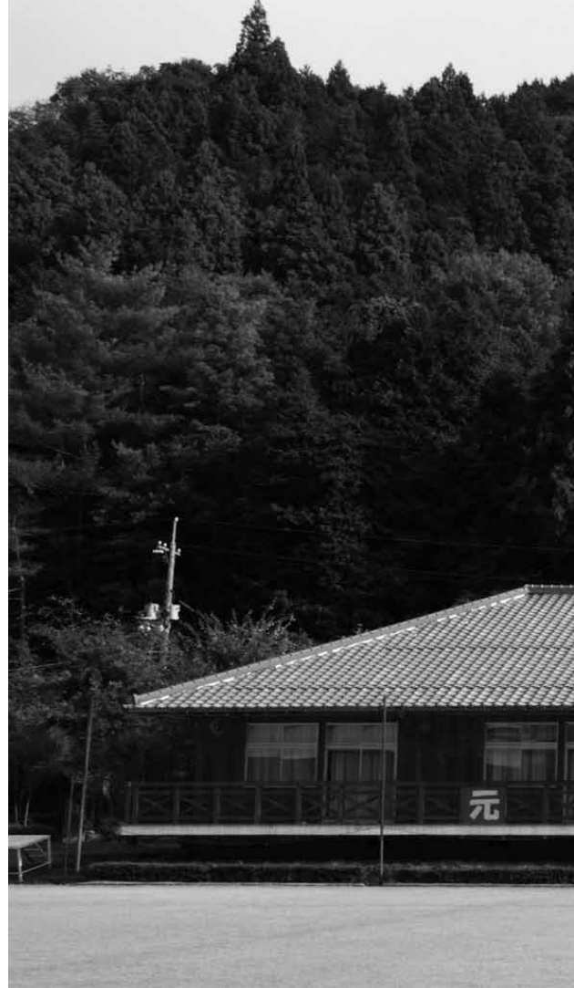
左鏡小学校。地域の人が手入れする芝生の校庭が自慢

が決められているからなんです。 でも僕は、ただ左鏡小学校の人数が少ないから統廃合しちゃうぞって、それはおかしいんじゃないかと思います。ただ人数が少ないから、税金の無駄使いだからっていうけど、小学校って人数とかお金とかそういう単純な問題だけでなくいいものなんですか。だって左鏡小学校には、すばらしいところがたくさんあるんですよ！